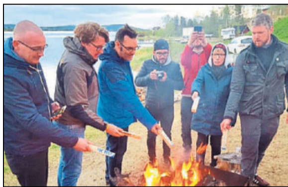
In Finnland entfachten die Teilnehmer der Charity-Rallye ein Mittsommerfeuer.

Unter dem Stichwort »Für die Ostsee um die Ostsee« können Interessierte die »Svens« auf dem Spendenportal www.betterplace.org oder über Facebook unter »Die schrecklichen Svens« unterstützen. Der Erlös kommt der Organisation »Black Fish« zugute